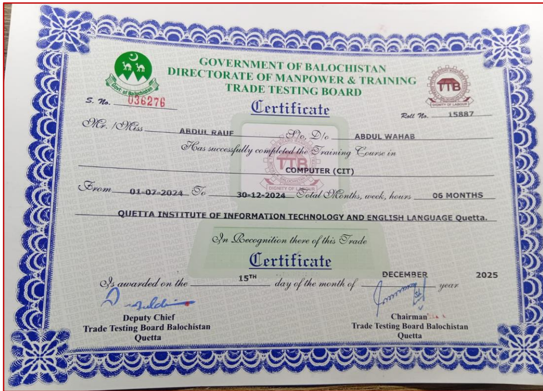
Certificate in Information Technology (CIT 6 Months)