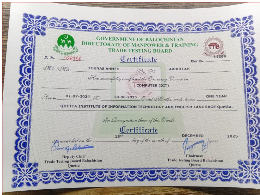
Diploma in Information Technology (DIT 1 Year)

نوٹیفکیشن کے مطابق کسی بھی سرکاری پوسٹ کے لئے صرف BITTB کا سرٹیفکیٹ ہی قابل قبول ہیں۔ لہذا QITEL کے تمام طلباء و طالبات کو مطلع کیا جاتا ہے کہ وہ جلد از جلد BITTB سرٹیفکیٹ / ڈپلومہ کیلئے رجسٹریشن کروائیں۔