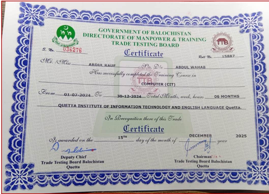
Certificate in Information Technology (CIT 6 Months)