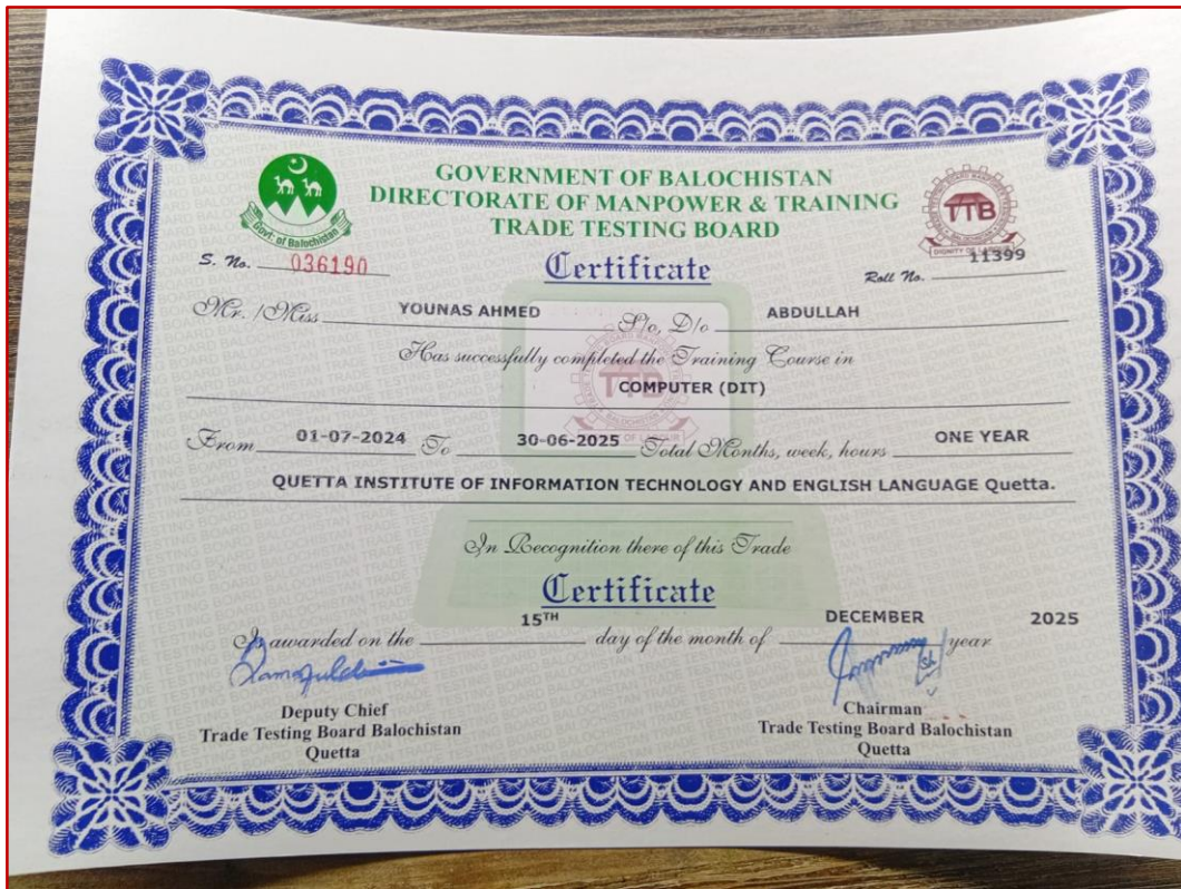
Diploma in Information Technology (DIT 1 Year)

نوٹیفکیشن کے مطابق کسی بھی سرکاری پوسٹ کے لئے صرف BITTB کا سرٹیفکیٹ ہی قابل قبول ہیں۔ لہذا QITEL کے تمام طلباء و طالبات کو مطلع کیا جاتا ہے کہ وہ جلد از جلد BITTB سرٹیفکیٹ / ڈپلومہ کیلئے رجسٹریشن کروائیں۔